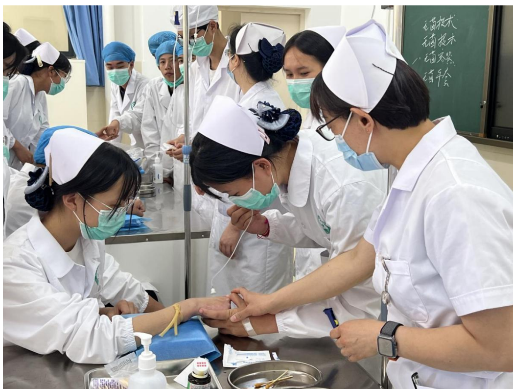
图 10 开展理实一体化实训教学

业教育理念。在实训教学中采用由情景案例标准化病人（学生扮演）而展开的理论与操作技能同时进行教学的模式，让学生在实训课中实现角色互换，既是病人又是医生，互相进行真实对话和操作，真实地共情患者感受。