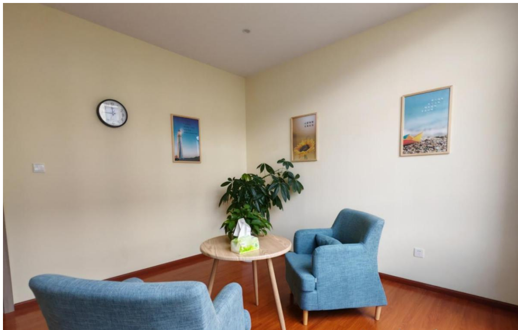
图 6 心理健康发展中心咨询室

次。2023 年组织开展了 5.25 心理健康活动，承办了玉溪心理学会 2023 年学术年会。学校自创校园心理情景剧《谁的青春不迷茫》荣获玉溪市首届高中中职学生校园心理剧大赛一等奖。学生心理健康问题得到缓解，学校心理健康教育工作再上新台阶。