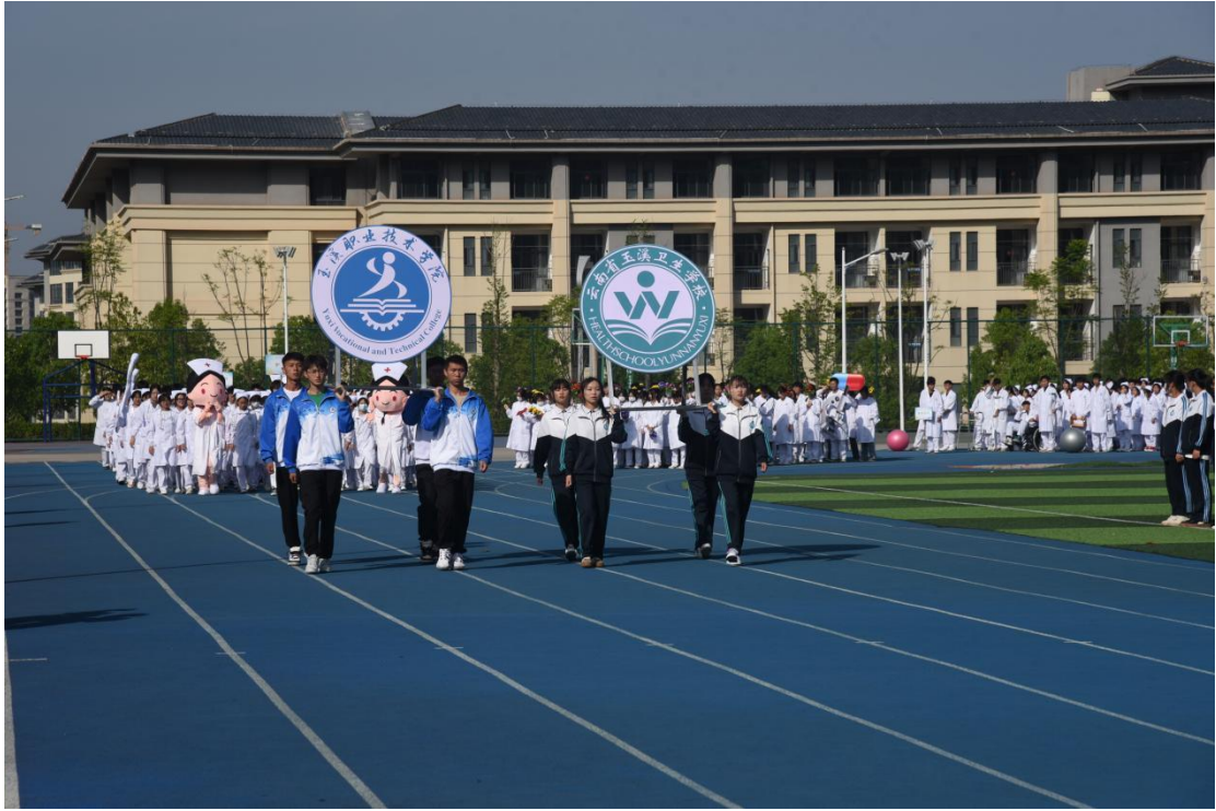
图 1 职业教育活动周开幕式