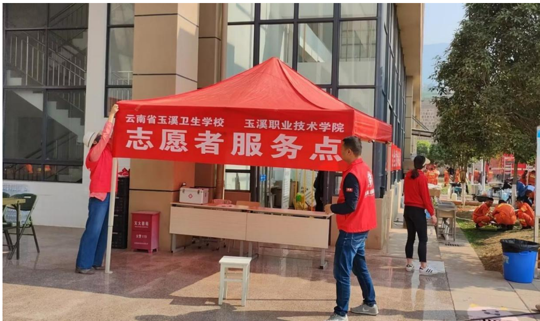
图 20 玉溪卫校搭建消防工作志愿者服务点