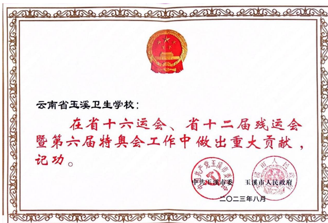
图 17 玉溪卫校在省运会工作中获集体记功