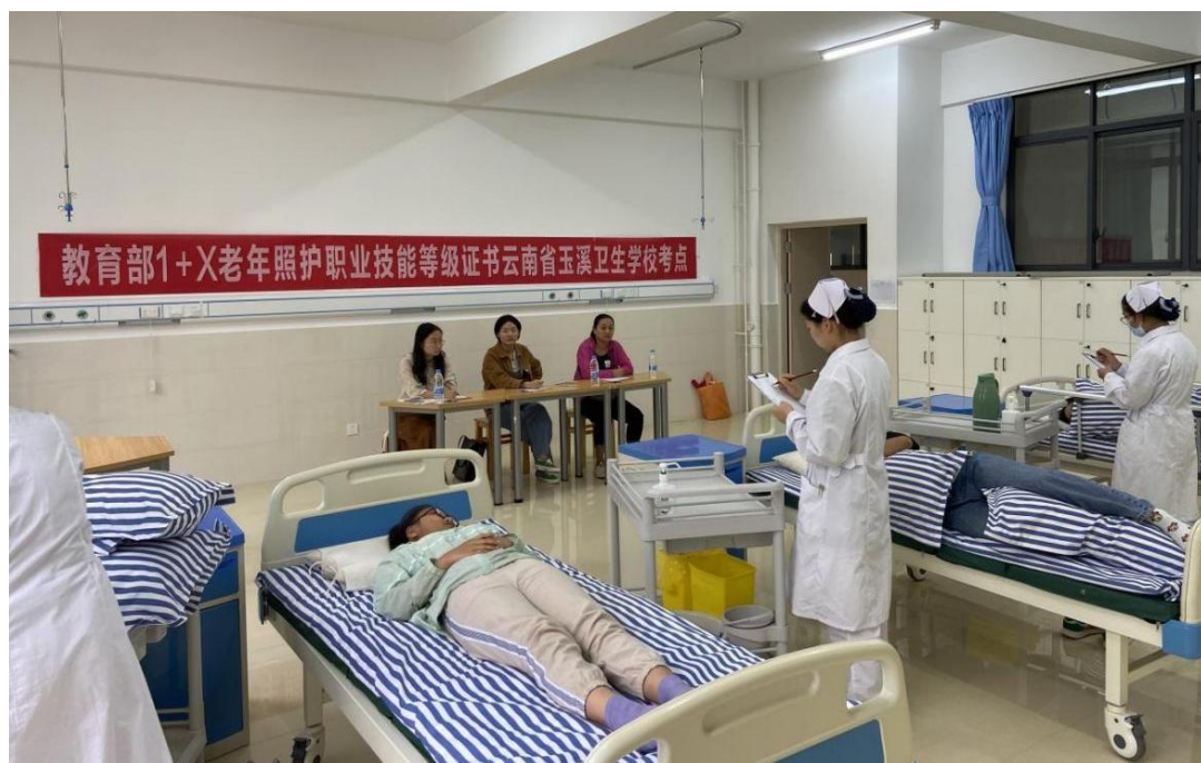
图 14 1+X 老年照护实操考试