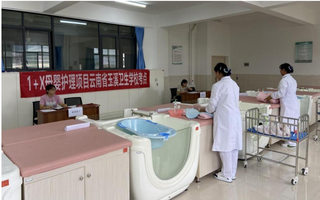
图 15 1+X 母婴护理实操考试