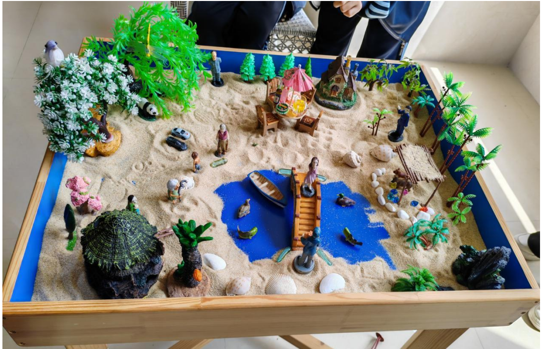
图 8 沙盘治疗室中学生摆放的沙盘