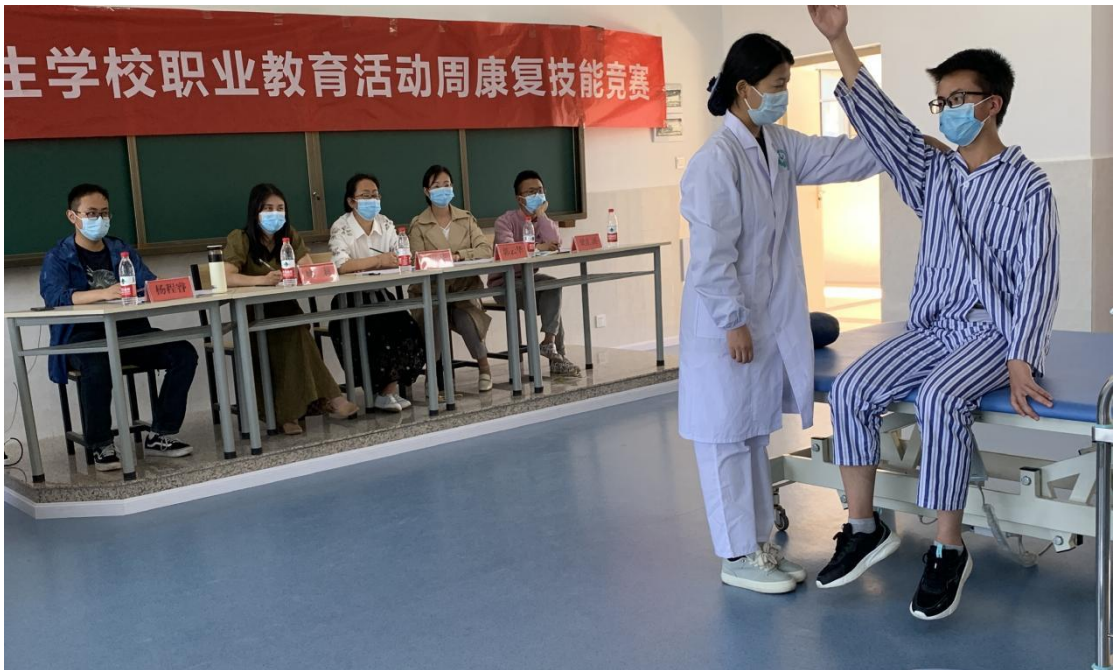
图 4 职业教育活动周康复技能竞赛