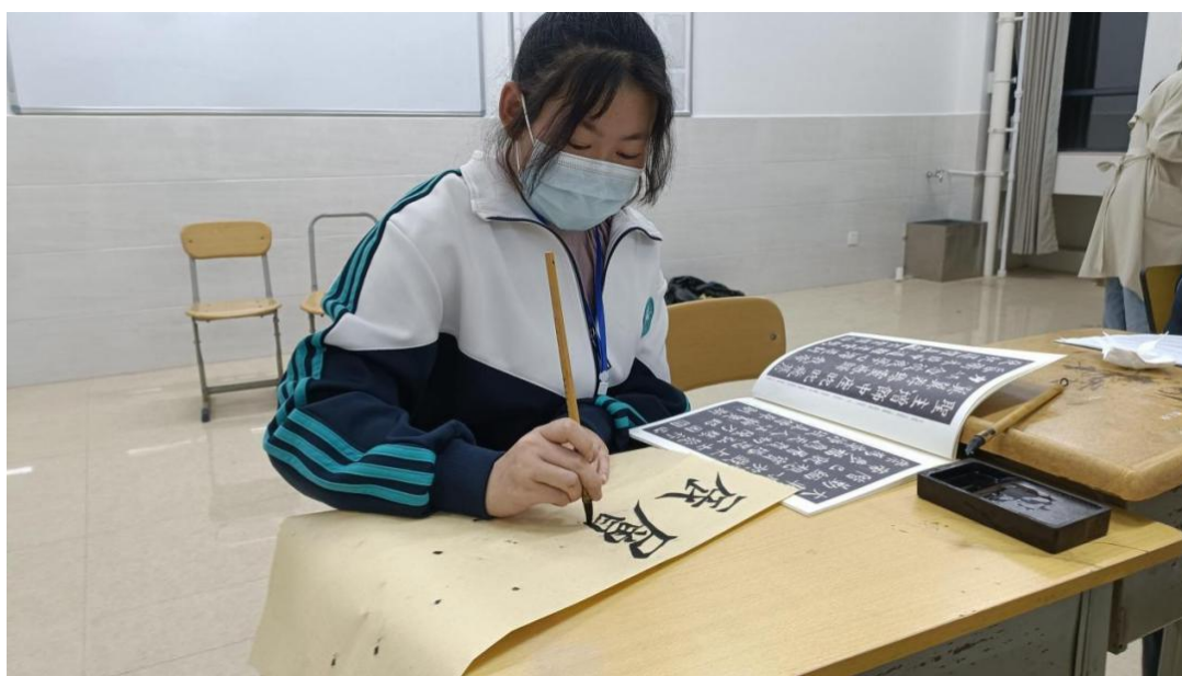
图 21 优秀传统文化教育——书法

玉溪卫校在丰富学生校园生活的基础上，聘请专业教师利用第二课堂，开设武术、茶艺、书法等传承中华优秀传统文化的第二课堂课程，参与人数 410 余人。在引导学生积极参与的同时，讲授中华传统文化的精髓所在，做好优秀传统文化传承工作，加强学生对中华优秀传统文化的认同和传承，增强文化自信、坚定文化自信。通过此类活动的开展，学生亲身学习体验中华优秀传统文化，汲取中华优秀传统文化的思想精髓，在培养自身兴趣的同时，学习了解中华优秀传统文化的博大精深。