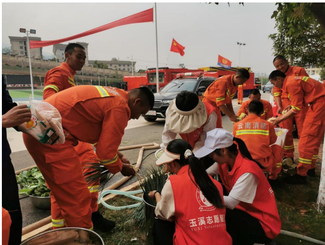
图 19 玉溪卫校志愿者为消防做好后勤工作

面对玉溪市江川区“4·11”森林草原防灭火工作严峻形势，玉溪卫校以高度的政治站位和责任担当，坚决贯彻落实市委、市政府关于森林草原防灭火工作的各项部署要求，服从命令、听从指挥、快速响应。玉溪卫校迅速成立应急保障值班组，组成 240 余人的师生党群先锋队，开展了设置志愿者服务点、维持驻点安保、布设休息房间、转运爱心物资、后勤帮厨等系列工作，全力以赴做好森林草原防灭火指挥部玉溪卫校驻地后勤服务保障工作，为火灾的顺利扑灭贡献了卫校力量。