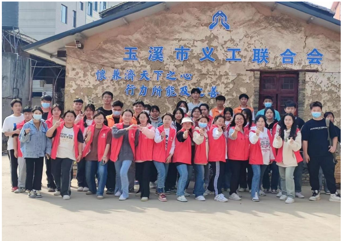
图 5 组织学生开展志愿活动