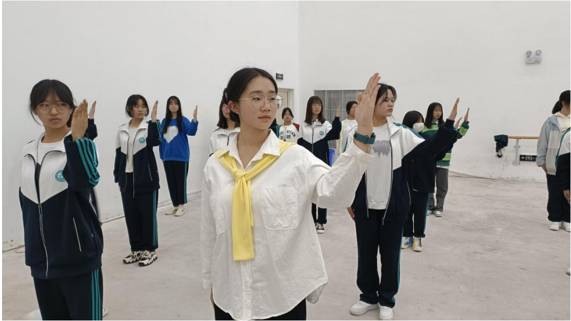
图 3 学生参加第二课堂礼仪课