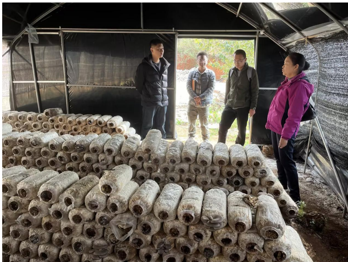
图 18 学校领导深入帮扶点调研乡村振兴工作

2023年选派乡村振兴工作队员1名，班子成员多次实地走访调研乡村振兴联系点，听取了村委会干部相关工作汇报，了解村委会实际困难，围绕本村工作重点进行分析研讨，对帮扶项目提出对策建议和工作要求，发挥学校特色为乡村振兴联系点办实事，共开展消费扶贫两次，帮扶乡村振兴联系点甘岔村修缮便民服务站，帮扶资金7万元。