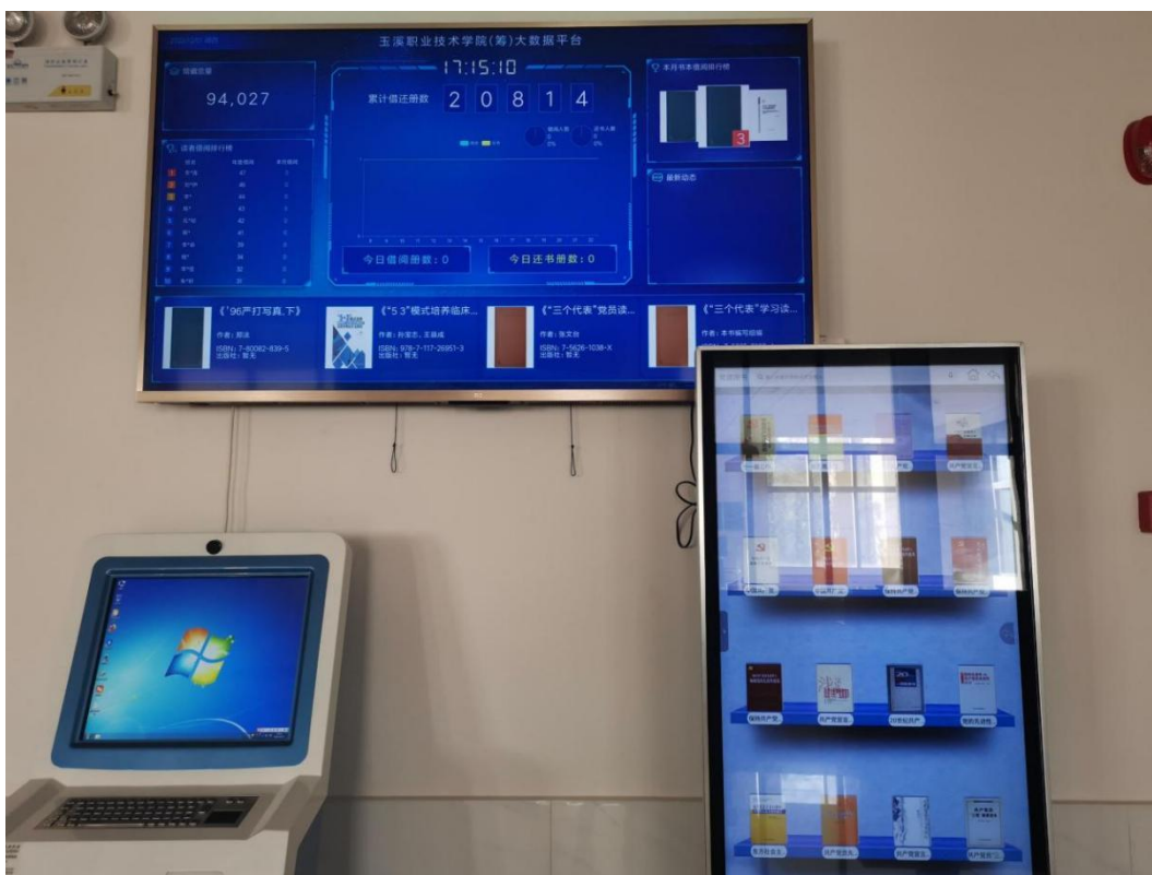
图 11 电子图书借阅机器

三是强化数字化教学资源建设。组织教师学习使用教育云平台，提倡教师使用教育云平台进行备课和资源分享，组织安排教师 148 人参加国家智慧教育公共服务平台暑期学习。进一步完善信息化硬件设施建设，全校共 668 台教学办公用计算机，1 个语音测评教室，1 间专业录播教室，1 套覆盖教学楼所有教室的常态监考及录播系统，每间教室均配备多媒体教学设备。图书馆实现实体阅读和电子阅读，电子图书资源总数达 311573 册。