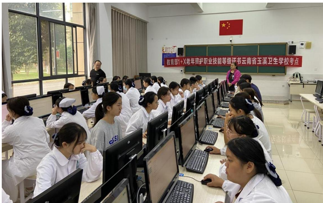
图 13 1+X 老年照护理论考试