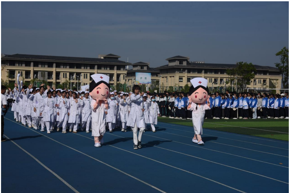
图 2 职业教育活动周各专业方阵