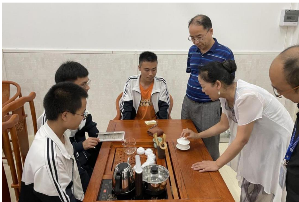
图 22 优秀传统文化教育——茶艺