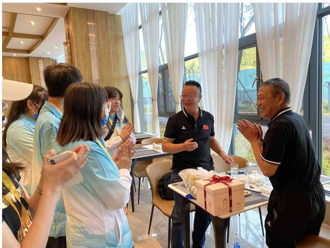
图 16 省运会志愿者为运动员及裁判庆生