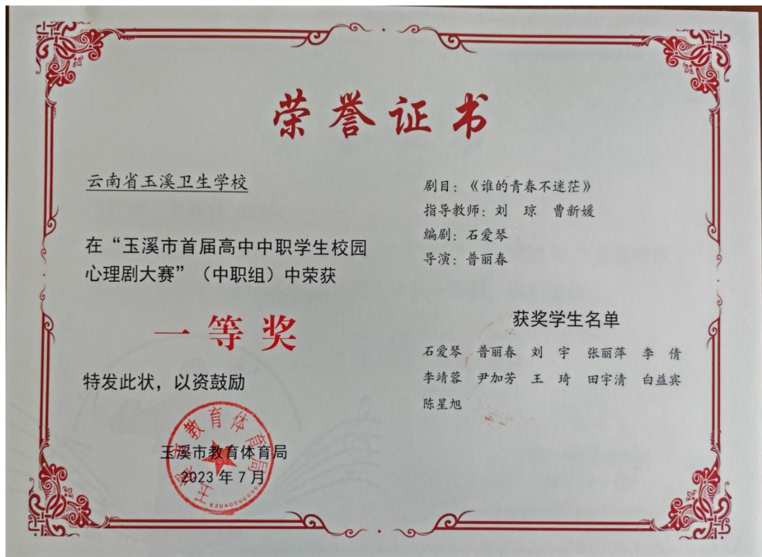
图 9 荣获校园心理剧大赛一等奖